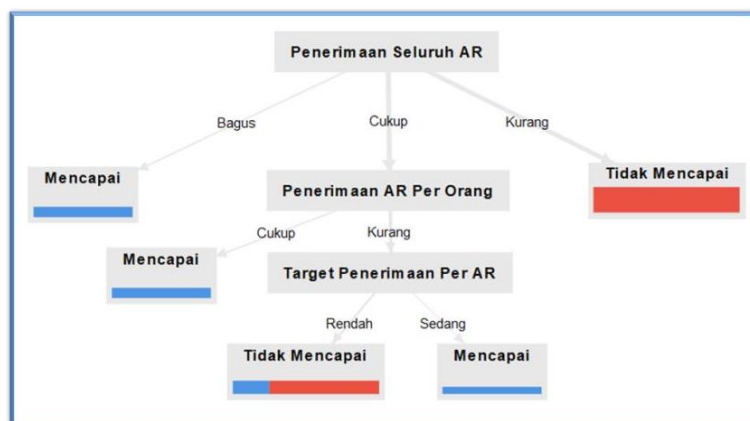
Gambar 4. Pohon Keputusan Penerimaan Account Representative

Berdasarkan hasil tabel 5, terlihat bahwa atribut dengan Gain tertinggi adalah TARGET PENERIMAAN PER AR, dengan nilai sebesar 0.13761. Oleh karena itu, TARGET PENERIMAAN PER AR dapat berfungsi sebagai node cabang dari nilai atribut Kurang. Terdapat tiga nilai atribut dari TARGET PENERIMAAN PER AR, yaitu Rendah, Sedang, dan Tinggi. Dari dua nilai atribut tersebut, nilai atribut Tinggi langsung menghasilkan keputusan Mencukupi dengan nilai 1, sehingga tidak diperlukan perhitungan lebih lanjut untuk nilai atribut tersebut.