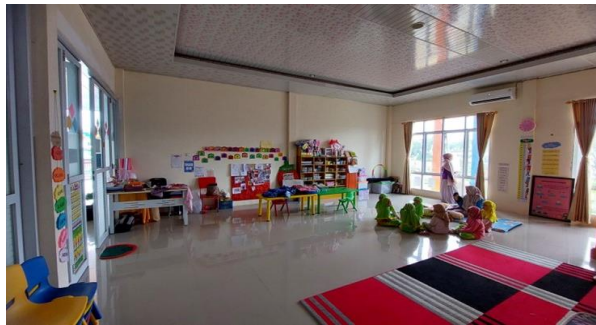
Gambar 6. Tampilan Pencahayaan alami Gedung Ummusabri